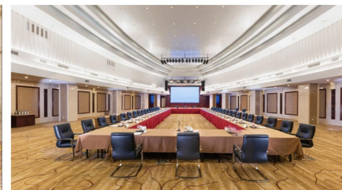
维笙雪野大酒店（济南市莱芜区雪野街道环湖东路3777号）