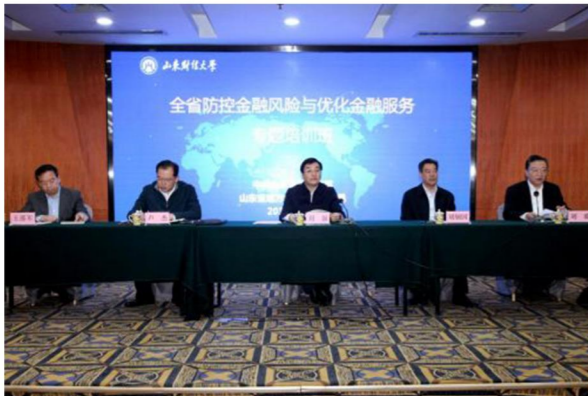
山东省防控金融风险与优化金融服务专题培训班