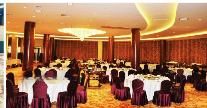
雪野湖假日酒店（济南市莱芜区航空路8号）