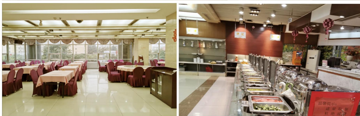
山东天舜大厦（济南市市中区舜耕路42-1号）