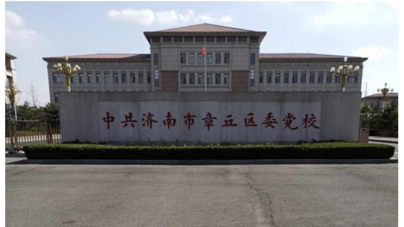
中共章丘区委党校（济南市章丘区世纪东路与双山北路交叉口）