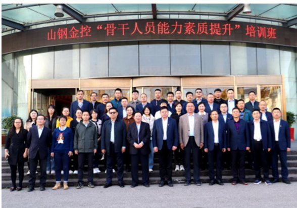
山钢金控 “骨干人员能力素质提升”培训班