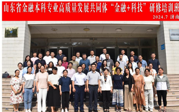
山东省金融本科专业高质量发展共同体“金 融+科技”研修培训班