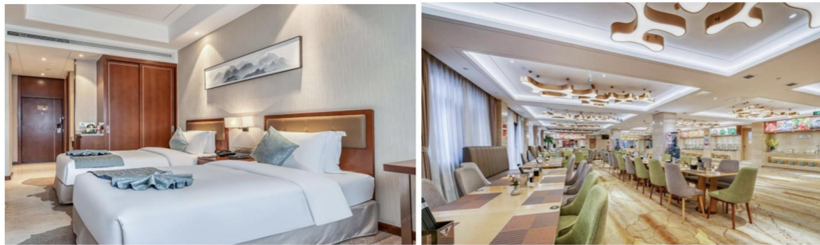
济南舜德蓝海大饭店（济南市历下区千佛山南路7号）