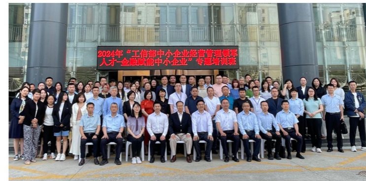
2024年“工信部中小企业经营管理领军人才 —金融赋能中小企业”专项培训班