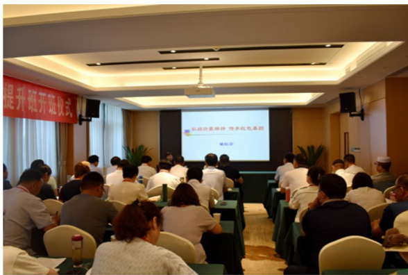
临夏州政协委员及政协干部履职能力提升培训班