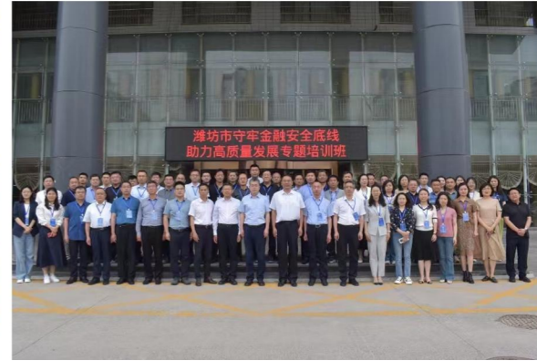
潍坊市守牢金融安全底线助力高质量发展专 题培训班