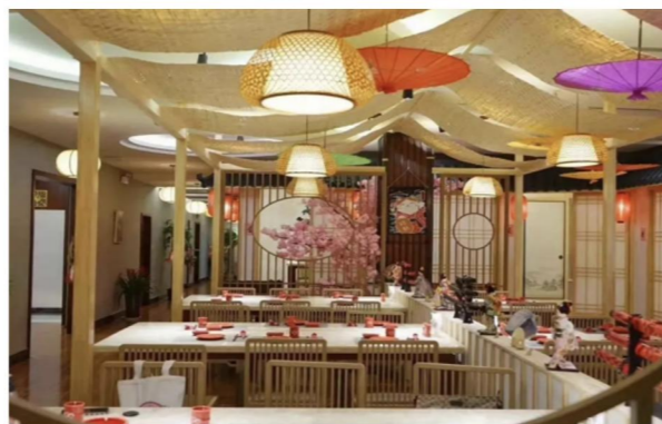
学景大酒店（济南市历下区二环东路7366号）