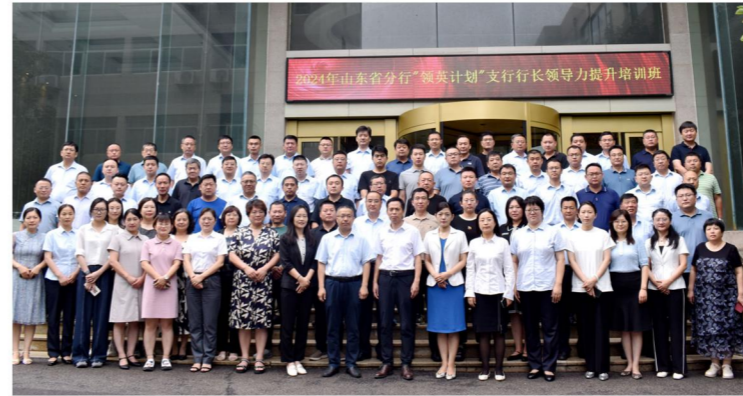
中国建设银行山东省分行“领英计划”支行 行长领导力提升培训班