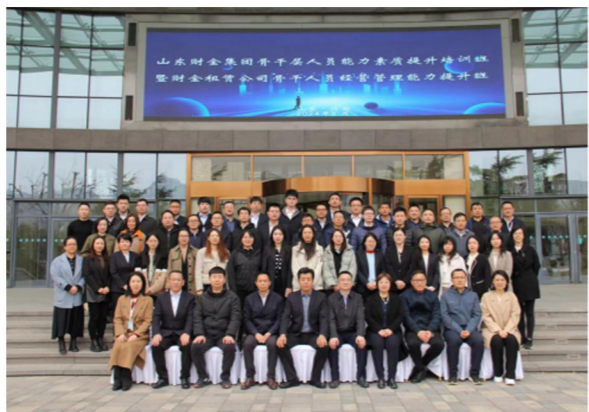
山东财金集团 “骨干人员能力素质提升”培训班